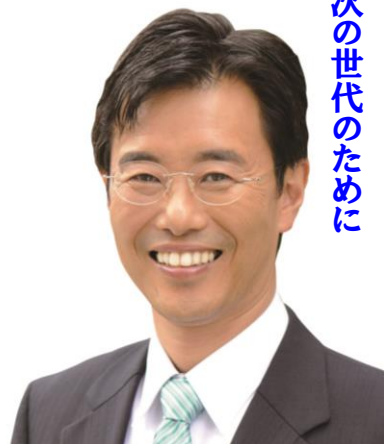
次の世代のために

大島の災害復旧・復興対策をはじめ、福祉の人材確保、再生可能エネルギーによる発電拡大、成長産業への支援などに一定規模の予算が計上されており、時宜に合った予算案となっています。